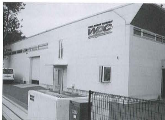
神奈川県相模原市南区大野台 4-1-83

第4回目の「現場に行こう!」は、2009年に業務拡大に伴い移転したSia神奈川工業団地内の同社本社・工場を訪ねた。