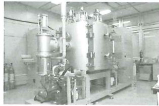
DLC炉 (DLCコーティング装置)

DLC (ダイヤモンドライク・カーボン) は、耐摩耗性と低摩擦を備えた硬い炭素系の薄膜であり、半導体のクリーンルームで、油やグリス等の潤滑剤の使用が出来ない場所や部品に使われておりました。近年では、シェーバーの刃の耐久性向上や腕時計の装飾、更には自動車の燃費向上を目的に、エンジン部品にも適用されています。これらの適用は、主に鉄鋼材料の上にコーティングされています。